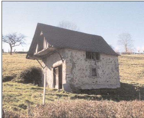
Le plancher avançant sur le pignon permet d'augmenter le volume du fenil et de créer un abri au rez-de-chaussée.

Le plancher du fenil est constitué de planches ou d'un platelage de petits rondins en branches de hêtre ou de noisetier. Il repose à la fois sur des poutres de forte section et sur un décrochement de mur d'environ 10 cm.