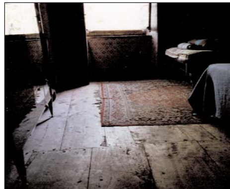
Plancher intérieur réalisé avec de larges planches clouées sur poutres et solives.

Interruption créant un vide sur le rez-de-chaussée afin de placer une échelle reliant les deux niveaux