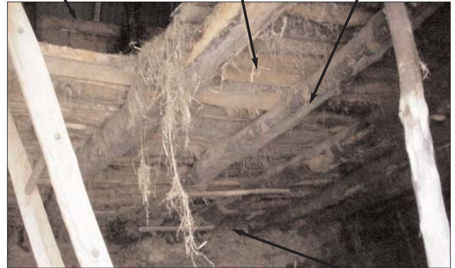
Vue sur le plancher du fenil d'une grange

Interruption créant un vide sur le rez-de-chaussée afin d'alimenter en foin les rateliers et les mangeoires