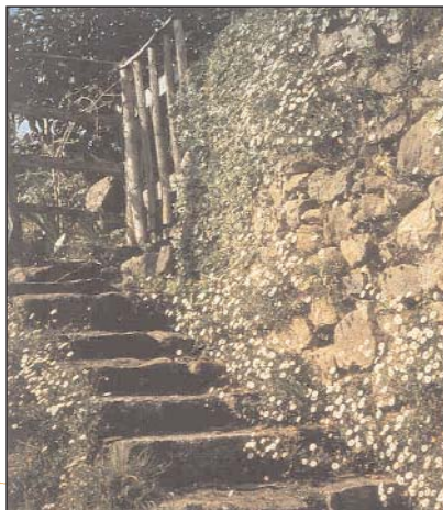
Muret de pierres sèches, escalier et érigo ns, Villargein, vallée de Bethmale