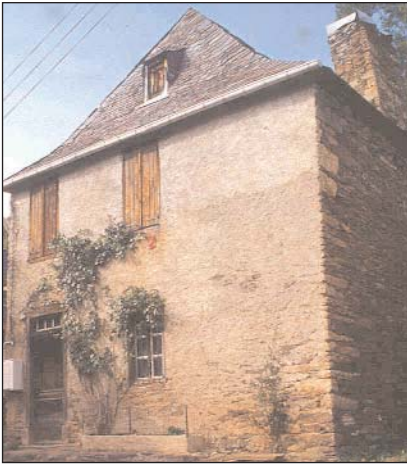
Rosier ancien grim pant (Etoile de Hollande), Le Playras, vallée du Biros