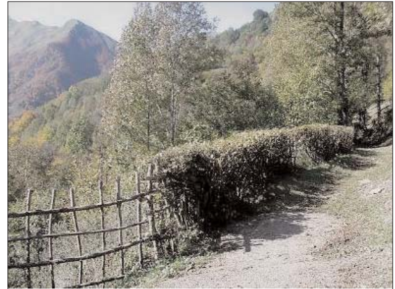
Portail bois et haie de noisetiers taillés, Le Playras, vallée du Biros