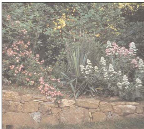
Muret de pierres sèches, Valérianes et rosier ancien, Bordes sur Lez