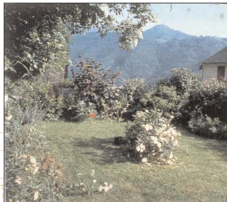
Clôture de grillage et haie libre à base d'arbustes à fleurs, Villargein, vallée de Bethmale