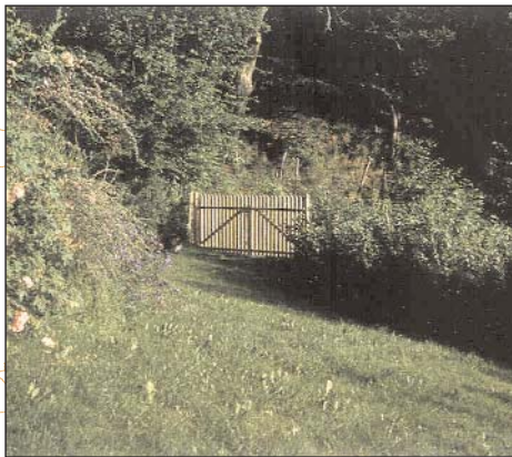
Clôture de grillage, haie de groseillers et portail en bois, Bordes sur Lez