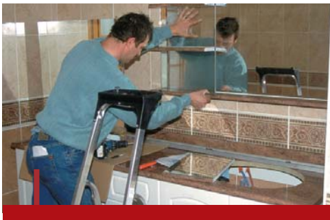
Le carreleur peut travailler dans des entreprises artisanales du bâtiment, des entreprises de travaux publics.

Le carreleur pose du carrelage, des dalles ou des mosaïques au sol et sur les murs.